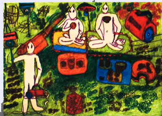
宇宙人のピクニック/宇根正弘