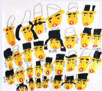
渡る世間は鬼ばかり/陽遊直貴