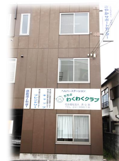
さやかサポートセンター